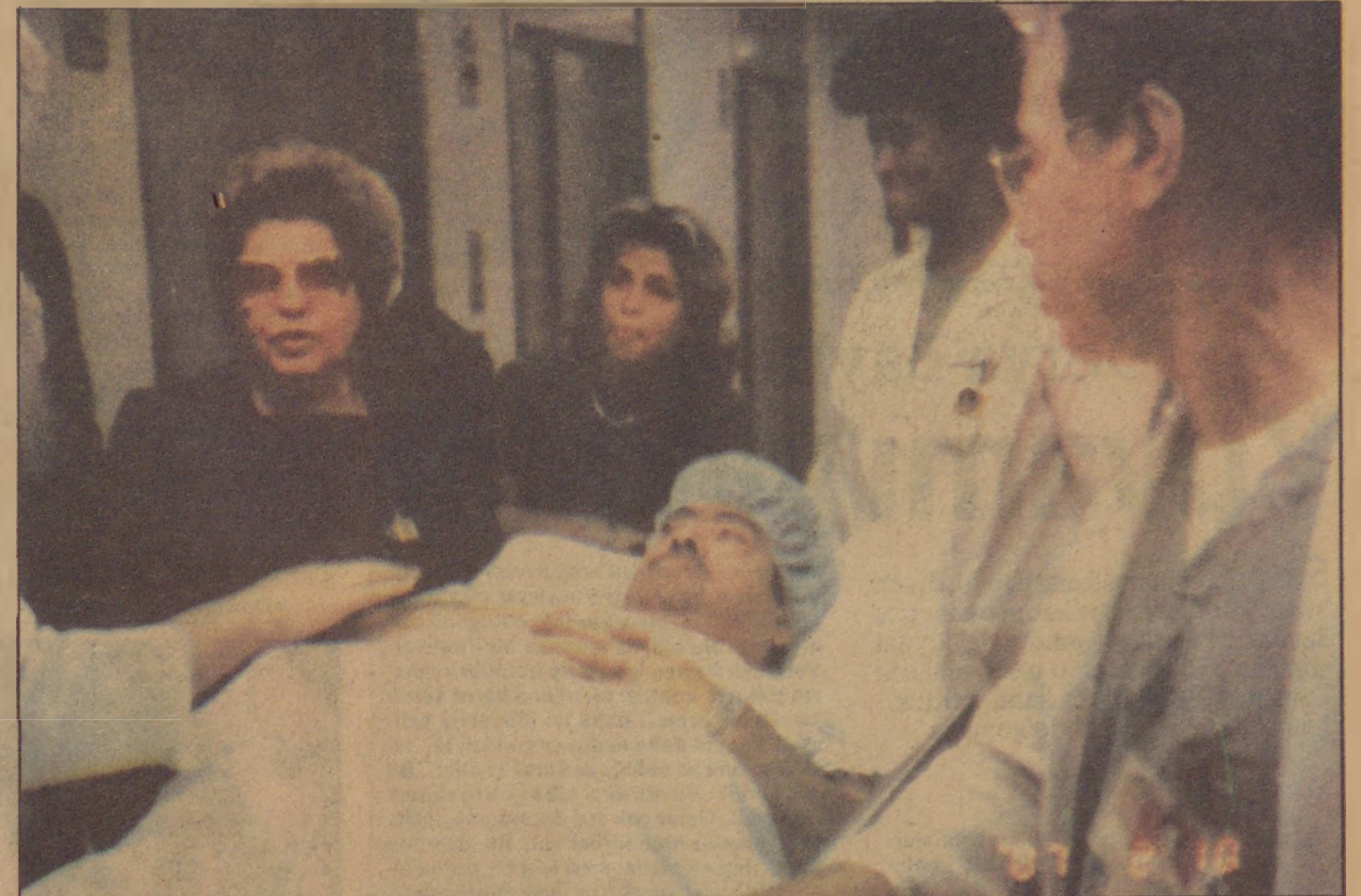
Başbakan Turgut Özal by-pass ameliyatına gidiyor. Başucunda eşi Semra Özal ve kızı Zeynep Başbakan'a sürekli moral veriyor. Ameliyathaneye girildikten sonra ünlü kalp cerrahı Deba-key'in başkanlığındaki 10 kişilik ekip 2.5 saat süren başarılı bir