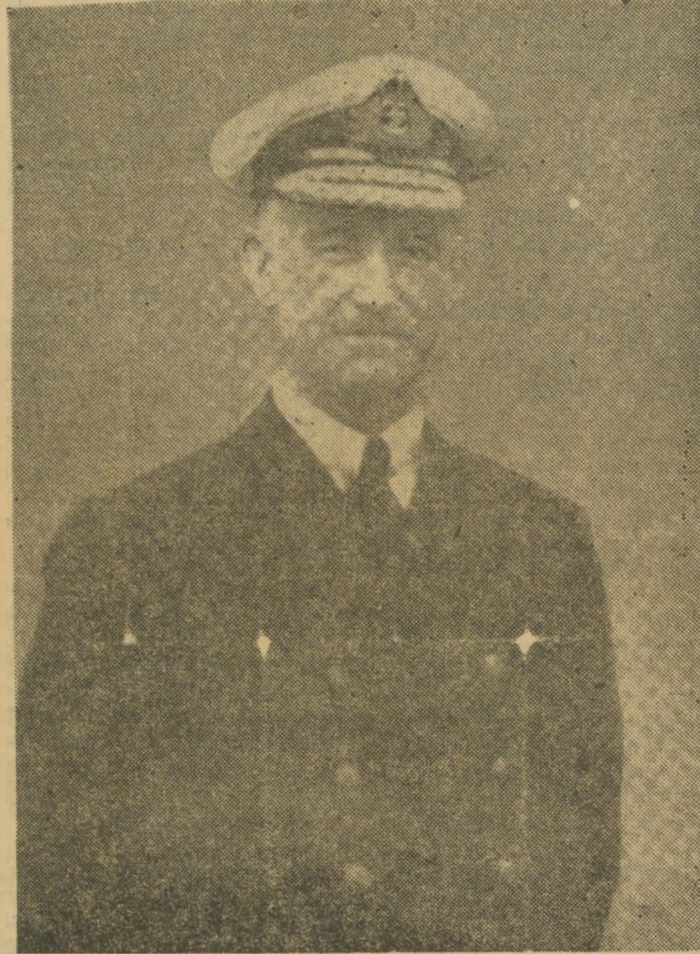
Reşid Paşa'yı ziyaret ederek tehditlerde bulunan Amiral dö Robek.