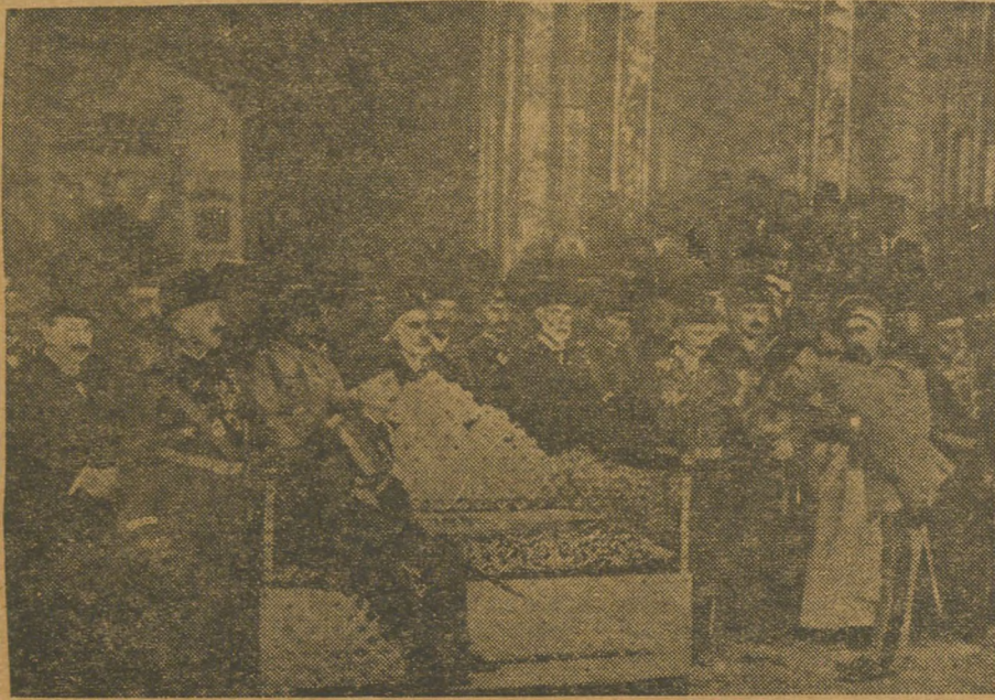
Padışah Vahidettin'in tahta çıktığı sırada çekilmiş bir resim.

Amiral dö Robek, diğer Yüksek Komiserlerle istişareden sonra Vahidettin'in teklifini reddetmeye karar verdi