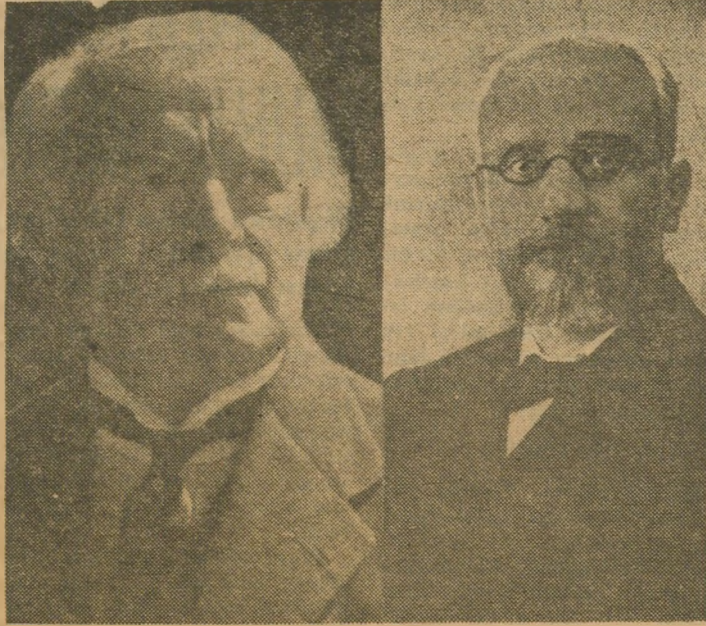
Türkiye'yi parçalamakta elele yürümekte olan Loyd Corc ile Venizelos.

«Elenizmin başkentinde yalnız mavi beyaz bayrağın dalgalanması gerekmektedir. Bugün muvaffak olamadıkça ümitlerimiz tamamiyle kaybolmamalıdır. Durum gene de müsaittir. Padişah'ın orada kalışı muvakkat mahiyettedir ve umduğumuz gib; Yunanistan'ın hudutları İstanbul'un hemen yakınına kadar varıyorsa böyle bir hal şekli gene sonunda lehimize olacaktır.»