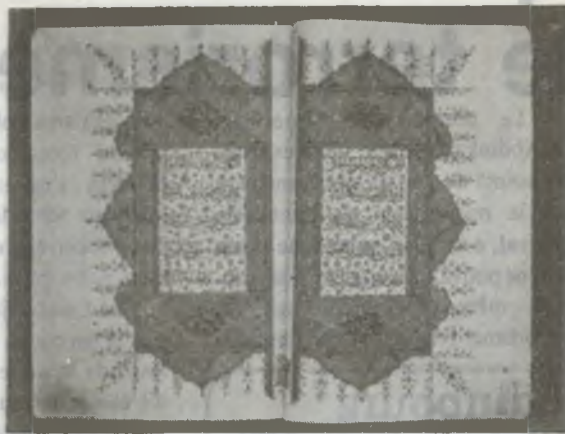
Manuscrits et calligraphies

Utilisé lors des époques qui suivirent comme bureau du trésorier général, "Mehterhane" (endroit où la musique impériale donnait des concerts populaires) et prison, le palais subit plusieurs transformations à la suite des incendies, tremblements de terre et de plusieurs restaurations; en 1906 sa majeure partie fut transformée en bâtiment de titres de propriété et de cadastres; en 1948 on fit détruire une grande partie du bâtiment lors de la construction du Palais de justice. Restauré depuis 1967, c'est aujourd'hui