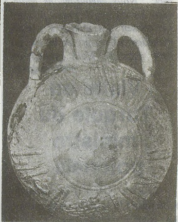
Céramiques et verreries

des palais propres aux grands vizirs ottomans. Le plus ancien document concernant le palais est l'histoire de Solakzade, qui parle d'une restaura-