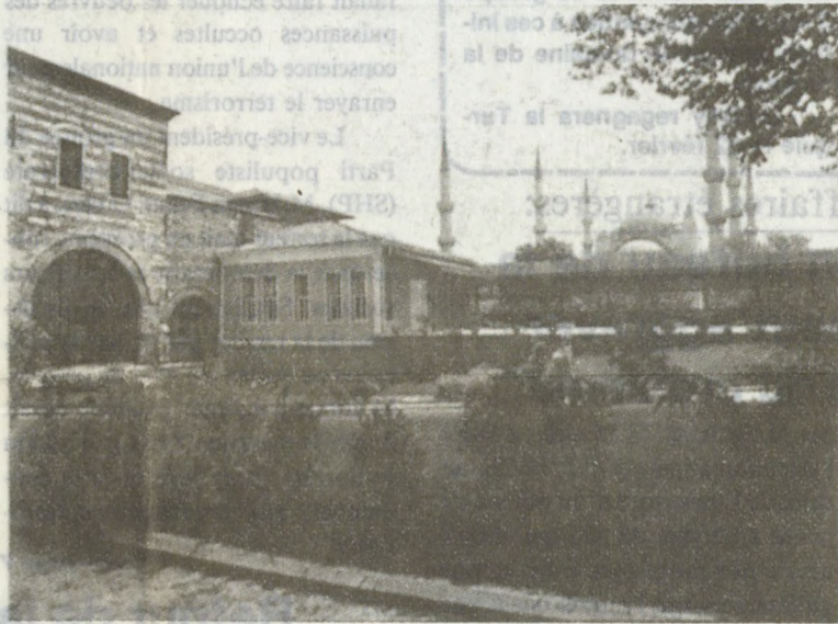
Du palais au musée

Vers la fin du 19ème siècle, les travaux pour regrouper les oeuvres turques et islamiques se sont accélé-