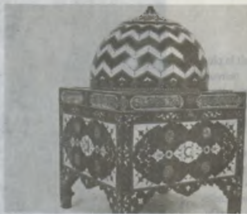
Travail du bois

gagna son amitié et son estime et qui lui servit de grand vizir pendant 13 ans. İbrahim Pacha qui tomba ensuite en disgrâce fut tué mais le bâtiment fut toujours appelé par le nom du grand vizir.