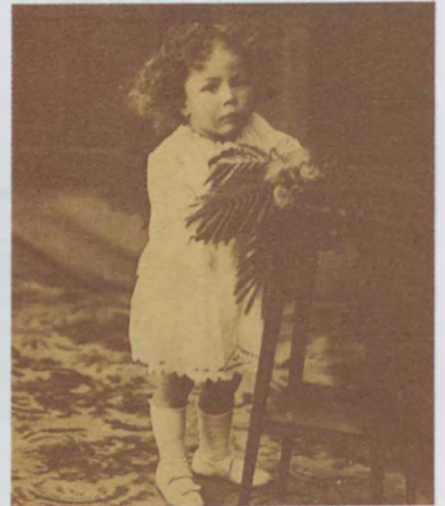
Fikret Muallâ kız özlemleriyle büyüdü