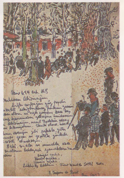
Suluboya illüstrasyonu (Rasih Nuri İleri Koleksiyonu) (Fikret Muallâ)

mez. Muallâ'yı iyi tanıyabilmek, anlayabilmek için çocukluk dönemini bilmek gerekir. Gelin o günleri Muallâ'yla birlikte bir nebze olsun yaşayalım ve sanat eleştirmenlerinin resimlerinin birbirine çok benzediği ileri sürülen ünlü ressam Lautrec'le olan kader birliklerine bir göz atalım.