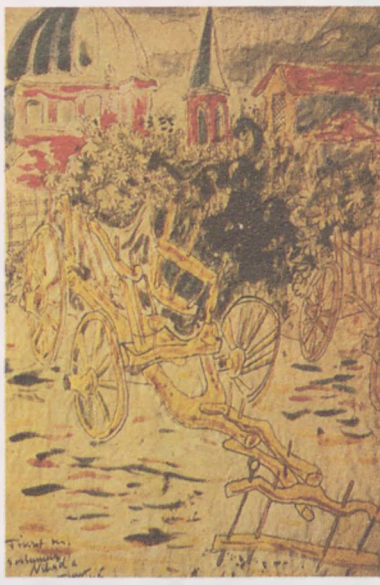
Cami Avlusunda Öküz Arabası (Prof. Mina Urgan Koleksiyonu) (Fikret Muallâ)