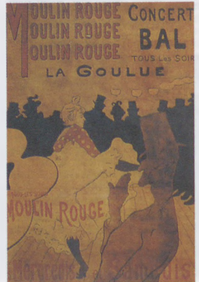
Lautrec'in ünlü afiş çalışmalarından biri

Muallâ birkaç kez akıl hastahanesine yatar. Bakırköy Akıl Hastahanesine ikinci yatışında oda arkadaşı Neyzen Tevfik, doktoru ise yine Mazhar Osman'dır. Tevfik'e hayran kalır Muallâ, hastaneden taburcu edilmek istendiğinde bir türlü ayrılmak istemez Tevfik'ten... Sanatçı hem doktorunu, hem Tevfik'i ömür boyu minnetle anacaktır. Muallâ gibi Lautrec de akıl hastahanesine yatmıştır. Lautrec'in akıl hastahane-