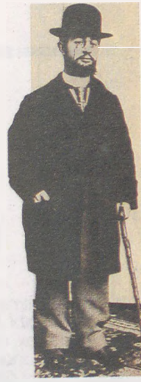
Henri de Toulouse Lautrec

Onun atölyesi Paris'in sokakları, Monparnasse Meydanı (Paris'te