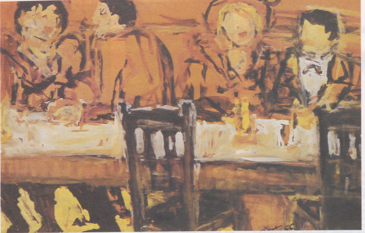
Oturan Dört Kişi (Fikret Muallâ)

sini kaybetmesine kendisinin sebep olduğu inancını taşımıştır ömür boyu. 1918 yılında kolera gibi salgın ve öldürücü olan İspanyol nezlesinin mikrobunu annesine kendisinin taşıdığını sanmış, buna inanmıştır. Buna neden de Kadıköy yakasında görülmeyen hastalık mikrobuna, okuduğu okulun semti olan Beyoğlu'nda sıkça rastlanılmasıdır. Annesinin ölümü ve bu ölümün üzerine Ekrem Bey'in hemen evlenmesi Muallâ'nın üzüntü ile şüursuzluk arasında bocalamasına, hırçınlaşmasına neden olmuştur. Üvey annesi Behice Hanım'la sık sık çatışmaya giren Muallâ'nın bu çatışmaların birinde babasının üvey annesini korumaya çalışması onu çileden çıkarır ve babasına el kaldırır. Muallâ babasına el kaldırdığı için aklından zoru var kaygısıyla Ekrem Bey tarafından o devrin tanınmış Ruh Doktoru Mazhar Osman Bey'e teslim edilir ve Bakırköy Akıl Hastahanesine yatırılır. Mazhar Osman, Muallâ'ya büyük yakınlık gösterir, özel muamele yapar ve Ekrem Bey'e oğlunun yurt dışına gönderilmesini teklif eder. Muallâ 17 yaşında önce İsviçre, sonra Münih ve daha sonra Berlin'e geçer ve Berlin Güzel Sanatlar Akademisi'nden mezun olur. Lautrec de Muallâ da ömürleri boyunca evlenmemişlerdir. Lautrec'in çevresi kadınlarla doludur ve çirkin yüzüne, kısa boyuna, sakatlığına karşın çok güzel ve ünlü kadınlara aşık olmuştur. Böyle olunca da bu aşklar hep tek taraflı kalmıştır. Muallâ'nın kadinsiz ve çocuksuz yaşamında iki