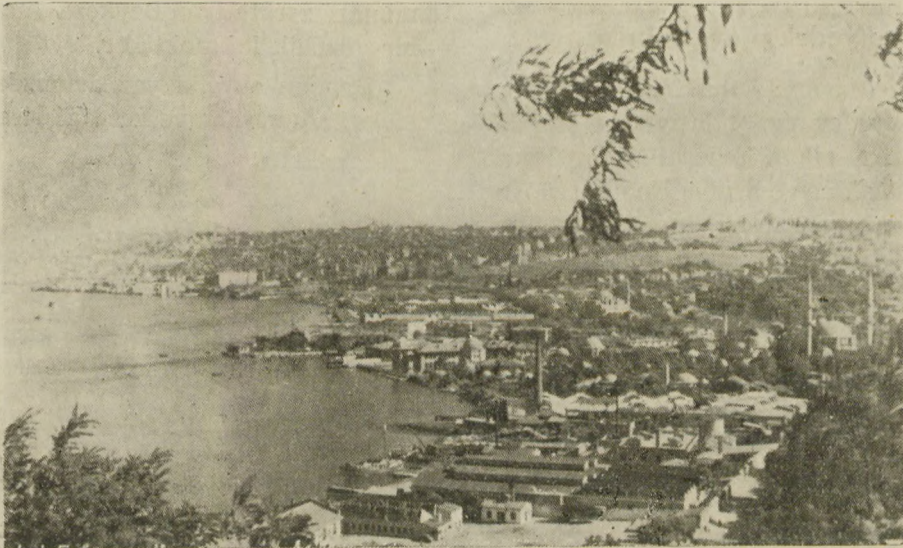
İstanbul — Eyubun Gümüş Suyu tepesinden umumî görünüşü Istanbul — Vue générale d'Eyub (Corne d'or)

Dönüş, gidiş gibi dağınık değil, topludur. Ka- yıkla avdet, pek hoştur. Herkes akşam vakti ka- yığna binmeğe başladı mı, dere kayıktan gö- rünmez. Bazan kürek işlemeyecek derecede ka- yıklar sıkışır, kimi kayıkta hanendegân-ı hoşâ-